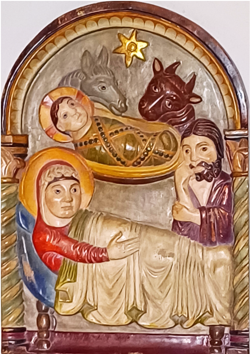
Geburt Jesu Christi romanisches Relief, etwa aus dem Jahr 1000