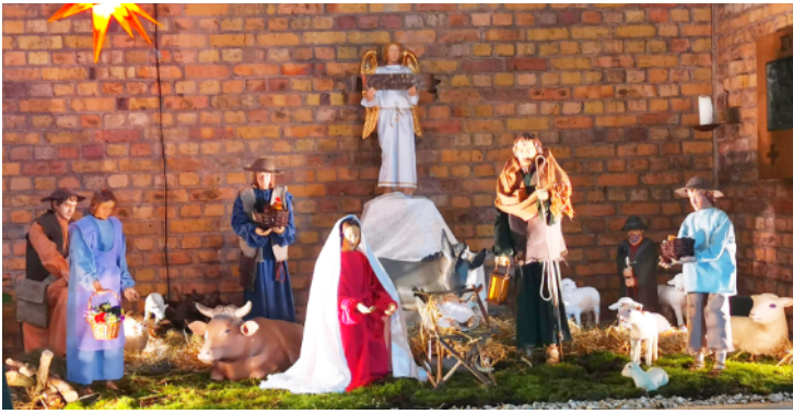
Foto: Die Treysaer Krippe mit Verkündigungsendel und den Hirten von Bethlehem. Das Krippenspiel wird von Kindern aus unserer Gemeinde vorbereitet. Sie zeigen uns anschaulich die Geburt von Jesus, wie sie auch in vielen Krippen dargestellt ist.