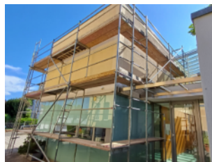
Foto rechts: Die Baumaßnahmen am eingerüsteten Pfarrheim (Ende August bis Mitte September) haben nur wenige Gemeindemitglieder mitbekommen.

Zudem wurden Aufträge an heimische Firmen vergeben, die eine Werterhaltung der Kirchengebäude sichern, u. a. Elektroarbeiten in der Kirche St. Peter, Zimmersrode.