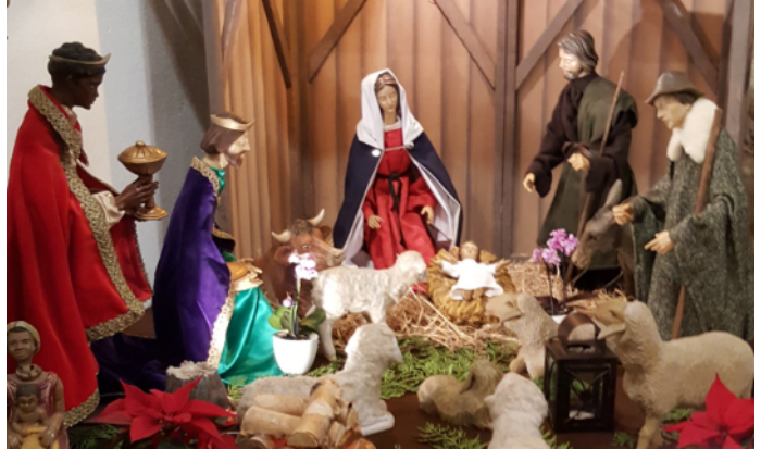
Foto: Die Weihnachtskrippe in Zimmersrode: Das Jesuskind auf dem Stroh der Krippe, Maria und Josef, rechts die Hirten mit den Schafen, links die heiligen drei Könige.

Stille Nacht, heilige Nacht! Gottes Sohn, o wie lacht Lieb aus deinem göttlichen Mund, da uns schlägt die rettende Stund, Christ in deiner Geburt!