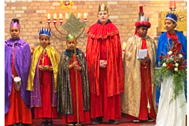
Aussendung der Sternsinger 2024 in der Heilig-Geist-Kirche

Das Motto „Erhebt eure Stimme! Sternsingen für Kinderrechte“ steht im Fokus der Aktion Dreikönigssingen 2025.